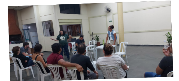
O Sindserv realizou reunião aberta a todos os professores, na sede central, dia 25 de novembro, onde foram apresentados os estudos da Comissão. O chamado à categoria para pressionar por mudanças no Projeto de Lei foi um dos principais pontos destacados.

O Departamento Jurídico do Sindserv esteve presente em todas as reuniões de análise do Estatuto do Magistério e tiveram a minúcia de comparar o documento com o Estatuto do Servidor para avaliar se a nova lei traria prejuízos ou avanços a carreira do professorado.