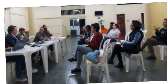
No dia 25 de julho, ocorreu Assembleia da Educação no Sindserv, com eleição de um representante e um suplente para ocupação da cadeira do Sindserv na Comissão de Educação e coordenação da Comissão do Sindicato.